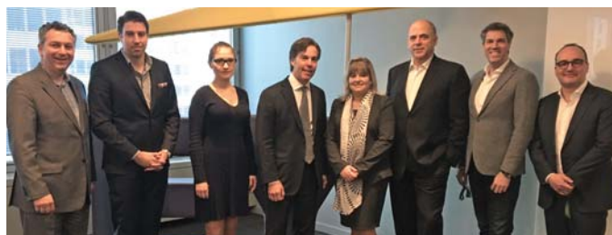
Photo prise lors de l'événement du 3 février 2017